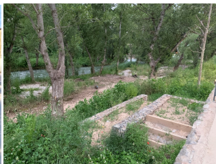
Camí de Cabrianes en l'actualitat.

Imatges del projecte i del Camí de Cabrianes que volem.