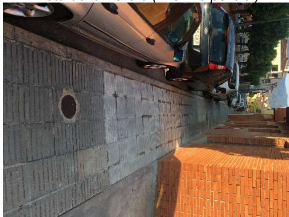
Vista de la vorera un cop reparada