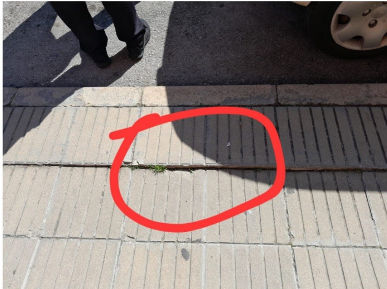
Vista de la vorera (informe policial).

La vorera té una amplada total d'1,15 m d'espai lliure de pas i disposa d'una il·luminació adequada.