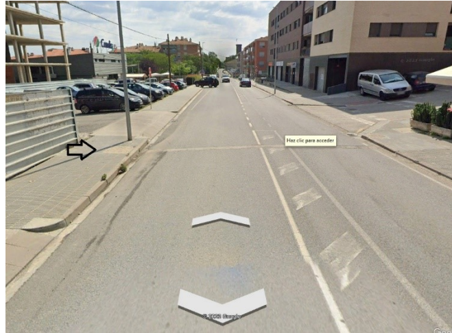
Vista de la canalització executada.

Els serveis Tècnics Municipals estan a disposició del sol·licitant per tal d'orientar-lo en la resolució dels passos anteriorment exposats.