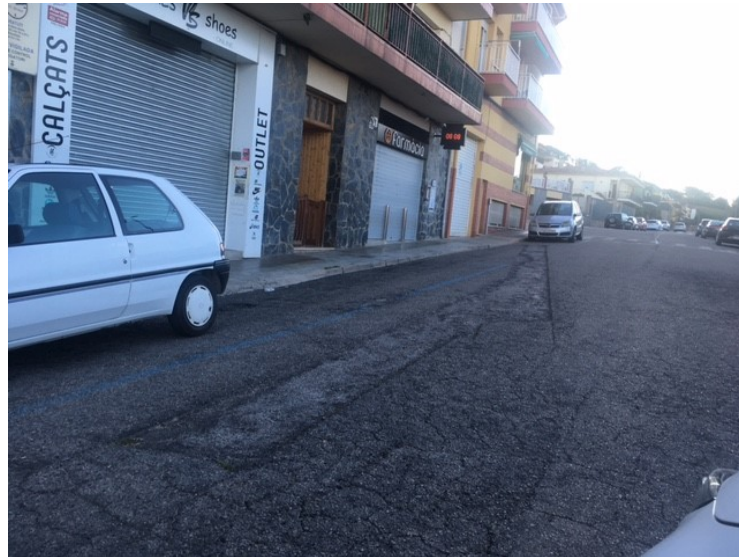
Vista del flonjall