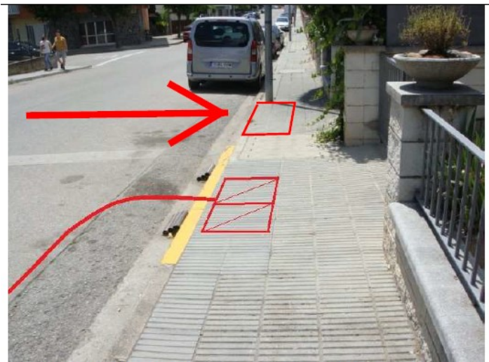
Pericó 17083PE0005 de finalització de la canalització a l'Avda. del Montseny

4.- Per no interferir en l'accés del gual existent es situarà el pericó final un cop superat l'arqueta existent de telefònica.