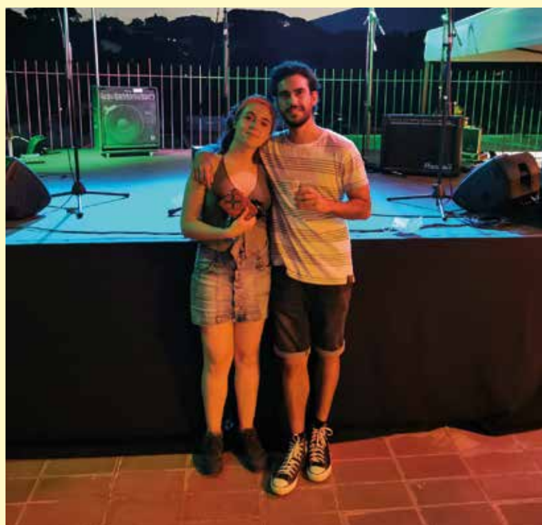
Moais, tercer classificat