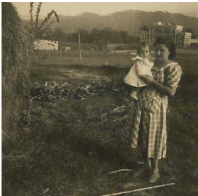
La Rosa Maria a coll de la seva mare, al fons l'estació de Riells

Fins a primers dels anys 80 es feia en el barri de l'Estació i això provocava una bogeria de gent;