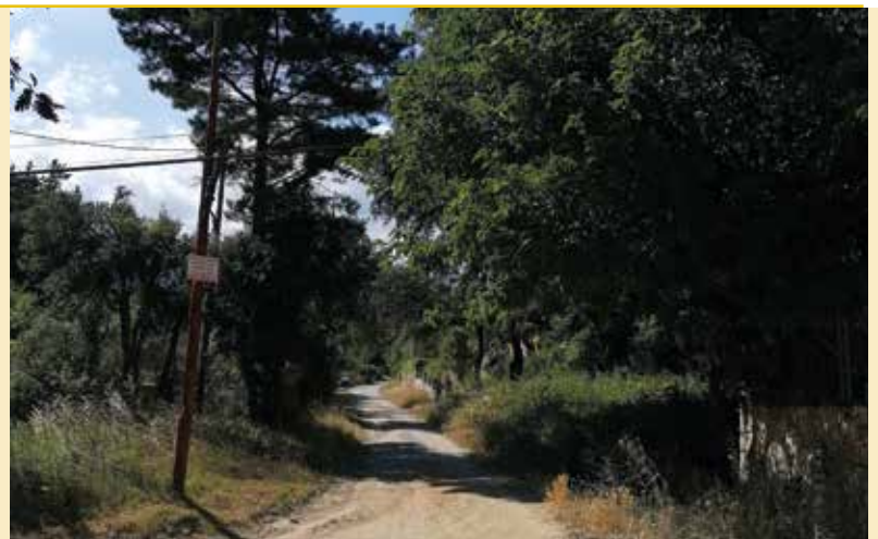
Entrada a Ca n'Hosta pel Camí de les Aigües

Aquesta petició molt demanada pels veïns i veïnes de la urbanització a arribat al seu final, ja que al juliol s'ha començat la instal·lació del cablejat necessari per connectar els habitatges a la fibra d'Adamo.