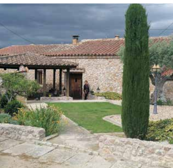
La Rosa Maria a l'entrada principal de la casa

De petita recordo que el meu pare tenia un cavall i amb "tamborets" portava la sorra al que va ser la fàbrica Plemen. No hi havia camions i ell, el meu avi i un mosso que tenia anaven a la riera a carregar-la. Més tard va comprar un camionet amb bolquet i a transportar per contractistes fins que va posar com a taxista a l'aeroport de Girona tot i donava servei a qualsevol veí que li requerís.