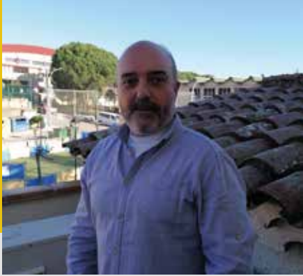
Josep M. Bagot i Belfort Alcalde de Riells i Viabrea