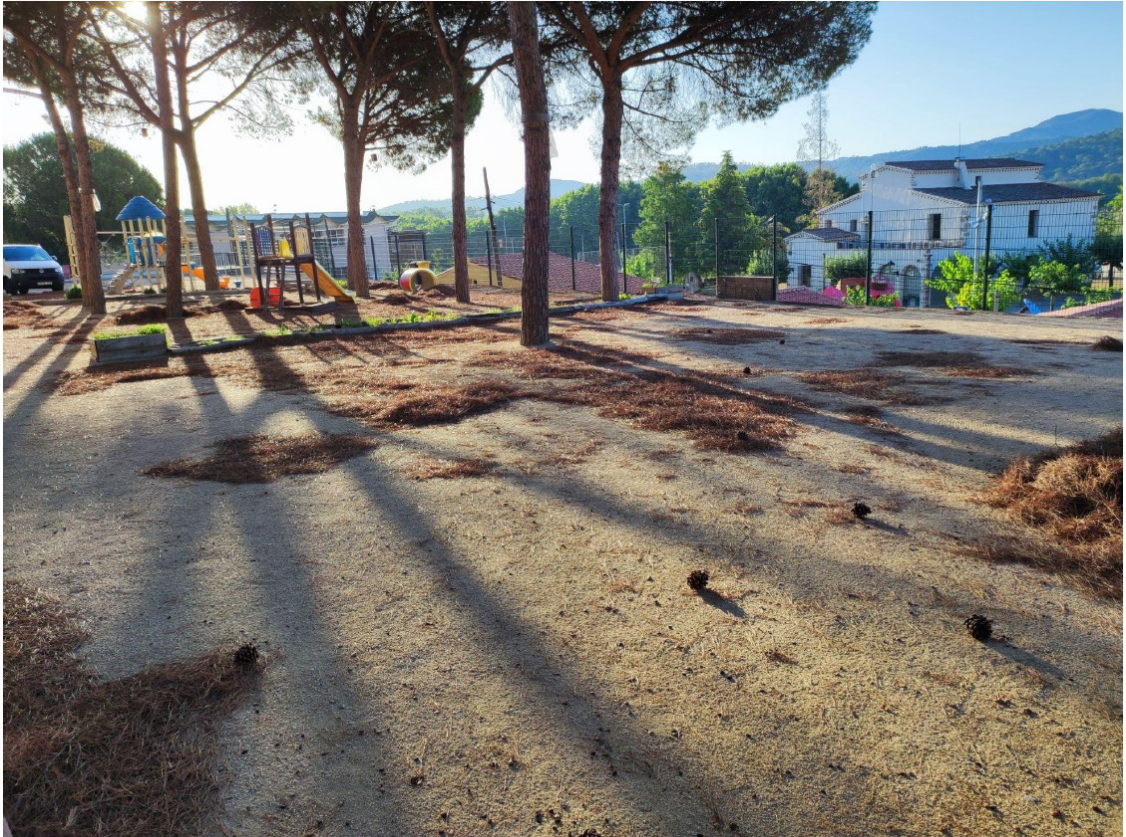
Imatge 2. Pati de l'escola el Bruc a primera hora del matí. Es pot observar la presència d'excrements d'aus a causa de la pernoctació d'aquestes.