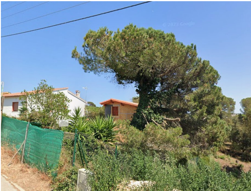
Imatge del pi