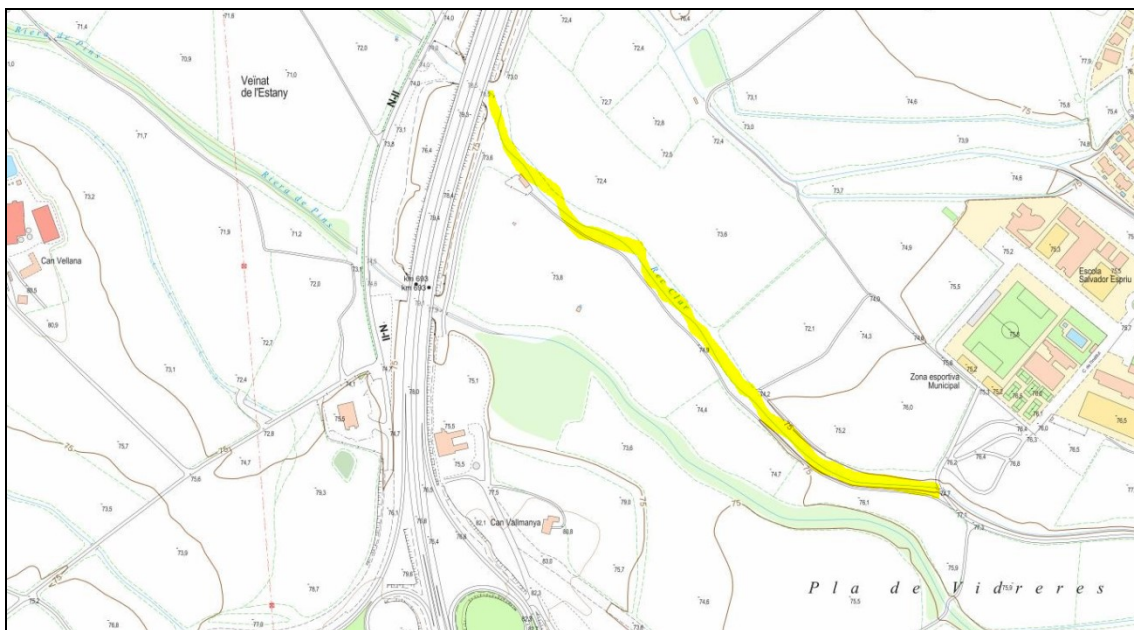
Fotografia 1. Topogràfic de la riera Rec Clar del municipi de Vidreres, marcat en color groc el tram de 750 m objecte d'actuació, i comprès aquest entre els punts amb inici el passadís a l'altura de la Zona esportiva Municipal i final a l'altura de la carretera N-II (Font: Vissir de l'Institut Cartogràfic i Geològic de Catalunya –ICGC; pàgina web: http://www.icc.cat/vissir3/ ).

Els treballs de manteniment i conservació de lleres públiques es consideren obres en l'aspecte de seguretat i salut dels propis treballs, segons els criteris tècnics per a l'execució de treballs de manteniment i conservació de lleres públiques de l'Agència Catalana de l'Aigua (ACA) –accessible tals criteris mitjançant dades obertes a la pàgina web https://aca.gencat.cat/web/.content/10_ACA/J_Publicacions/03-guies/00_Criteris_conservacio_lleres.pdf .