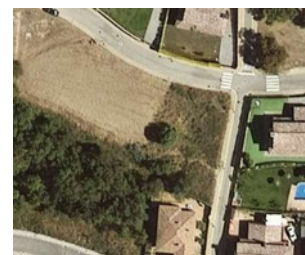
Ortofoto vigent ICGC