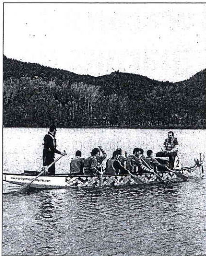
Una embarcació del 'Dragon boat' a l'Estany, el dia de la presentació del festival a la premsa

partir de les onze del matí es faran les regates –per categories– fins a mitja tarda. A les sis es lliuraran els premis. Al marge de les curses, s'ha previst un programa d'activitats sobre la cultura xinesa: uns tallers de calligrafia, tai-xí i kung-fu , uns altres sobre el llagut (una de les embarcacions tradicionals catalanes), la figura del drac en les cultures xinesa i catalana, com també unes demostracions sobre la gastronomia dels dos països. Ho organitza una empresa privada