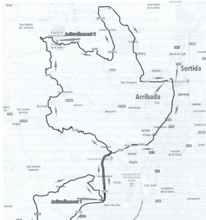
Marxa Cicloturista GERUNDONA, (Girona) 29 de setembre del 2019

Ajuntament de Brunyola i Sant Martí Sapresa