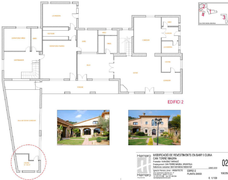
Àmbit actuació edificació annexa, cuina. EDIFICI 2