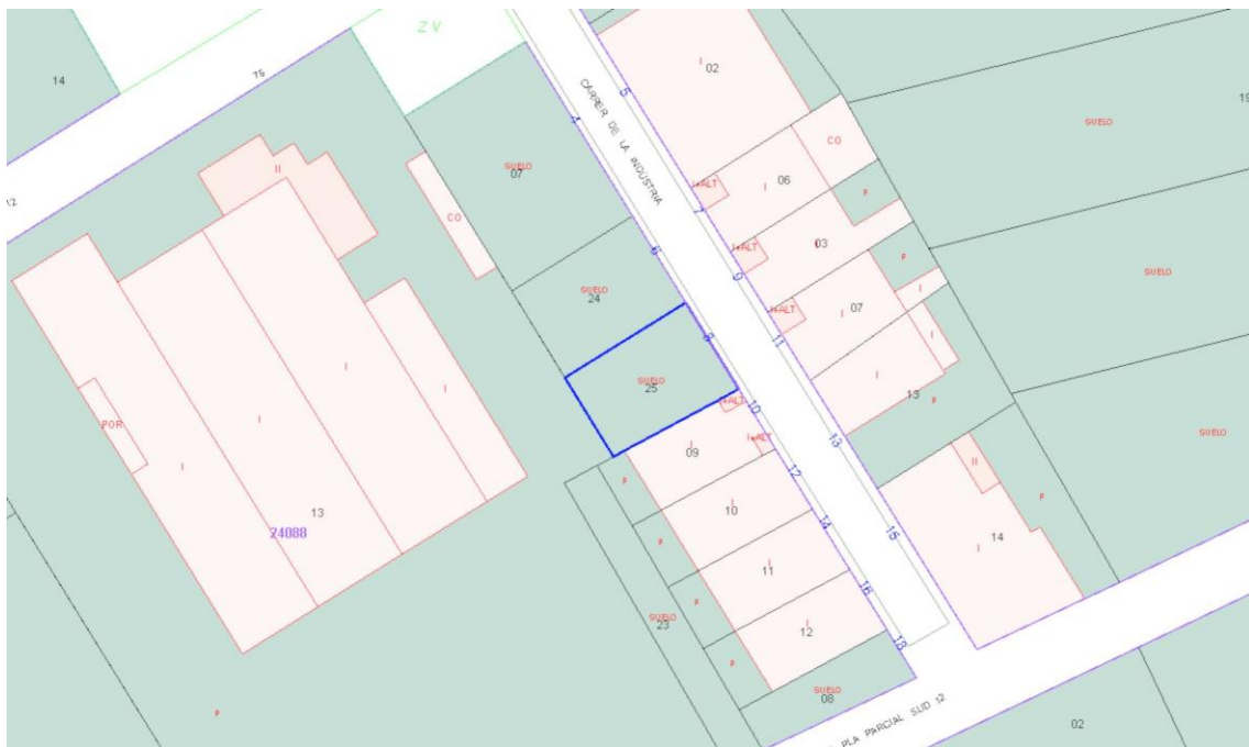
Emplaçament sobre plànol del cadastre