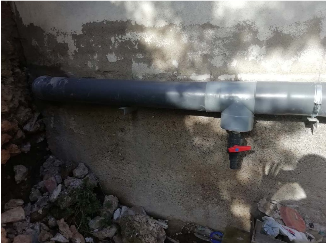
Aixeta instal·lada al fons de la finca per subministra d'aigua al hort.

Plànol de situació del tub en la parcel·la: