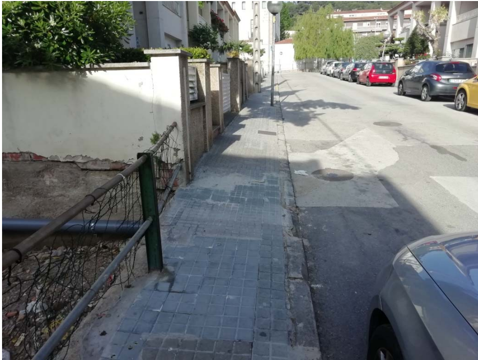
Connexió tub amb canalització-arqueta regants