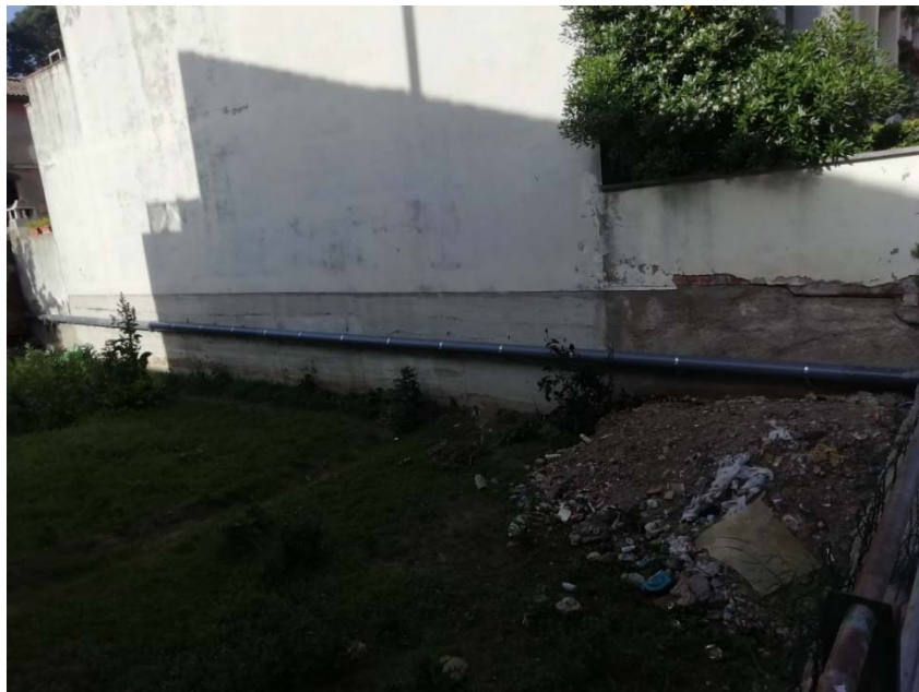
Vista general del tub dins la finca carrer ***** i suportat en el mur de la finca carrer *****