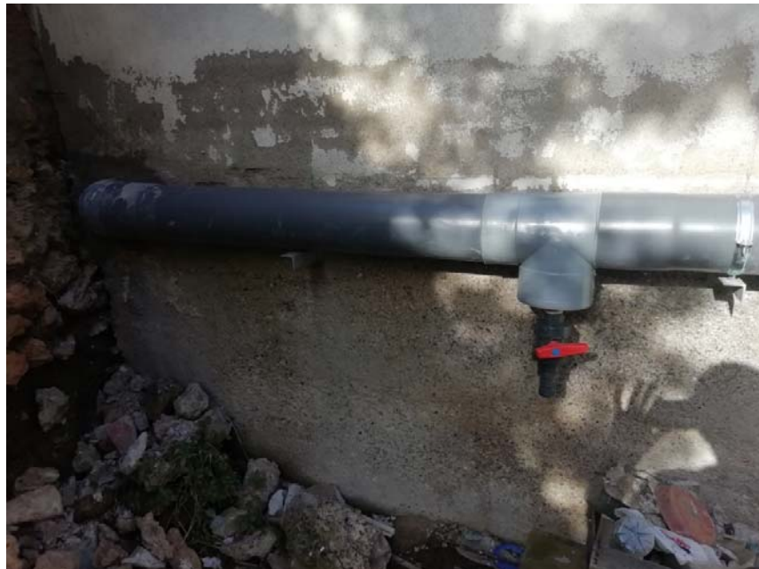
Aixeta instal·lada al fons de la finca per subministra d'aigua al hort.