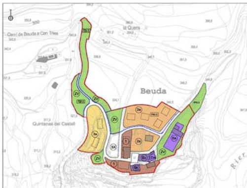
ÀMBIT PAU-04 EN EL NUCLI URBÀ DE BEUDA