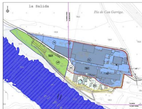
ÀMBITS PAU-05 EN BESALÚ I PAU-04 EN BEUDA