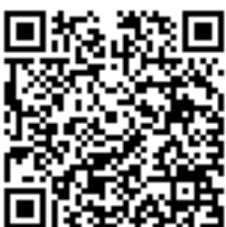
Annex 1. Relació de trams de carretera

Doc. original signat per: Serveis Administració Electrònica Generalitat de Catalunya 11/07/2019