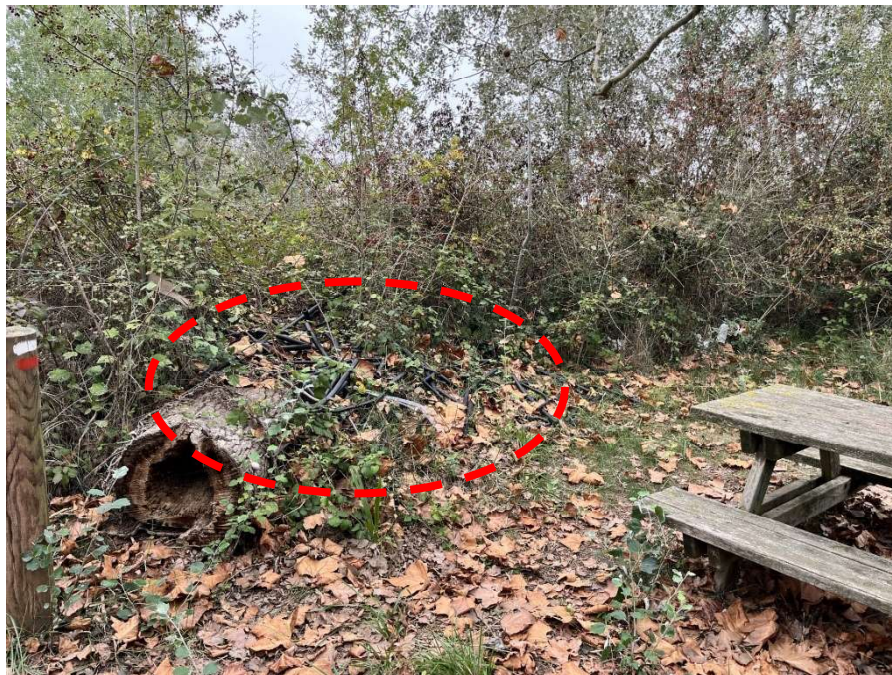
Vista de les restes de tubs de plàstic

Un cop feta la inspecció visual de la parcel·la i realitzades les fotografies adjuntes a la present acta, la tècnica sota signant abandona la finca essent les 12:40 h.