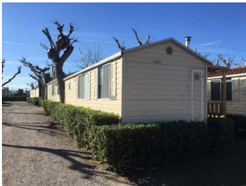
mòbils Homes preexistents

que les superfícies interiors dels nous bungalows podrien variar en relació a les que tenien els mòbils homes preexistents, es considera oportú requerir que es redacti un Pla Especial que estableixi les dimensions màximes que poden disposar els nous establiments dins del càmping abans de la concessió de qualsevol llicència d'obres.