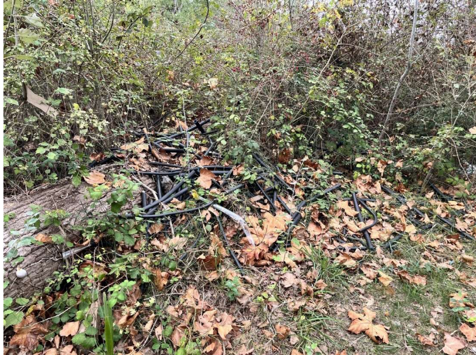
Vista de les restes de tubs de plàstic

Ajuntament de Sant Pere Pescador Alt Empordà